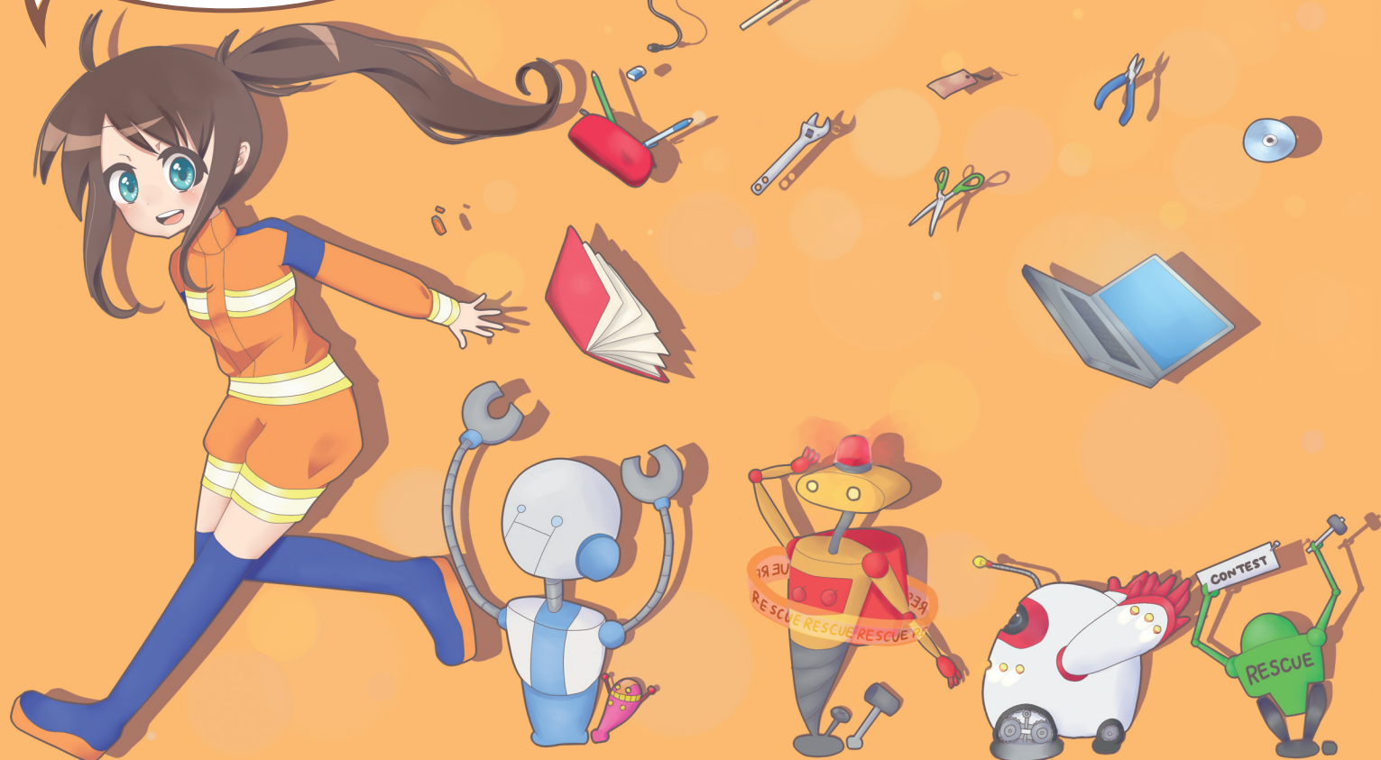
Illustration by 土井あかね

レスキューロボットコンテストって、災害救助をテーマにした ロボットコンテストなの。参加チームの人たちが、自分で作ったロボットを 離れたところから操縦して、模型の街から逃げ遅れた人に見立てた 人形を救出するよ。コンテストだけでなく、ロボットの展示や 操縦体験もあるし、工作教室などもあるわ。 それから今年も震災復興応援特別企画をやるから、みんな見に来てね！