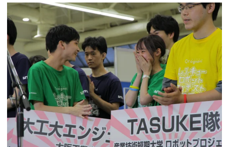
救助の考え方やアイデアを評価

厳正な審査を経て選出されたレスキューロボットコンテスト2026出場チームは、以下の通りです。