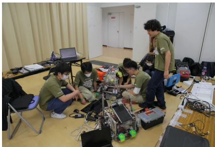
有志メンバーでチームを結成

またレスキューロボットコンテスト2026では、大塚化学株式会社ならびに株式会社グーテンベルクが特別協力企業として新たに参画いただき、3Dプリンタ用フィラメント（製品名：ポチコンフィラメント）を提供及び3DプリンタG-ZEROを、コンテスト参加チームへ貸与いただけることとなりました。