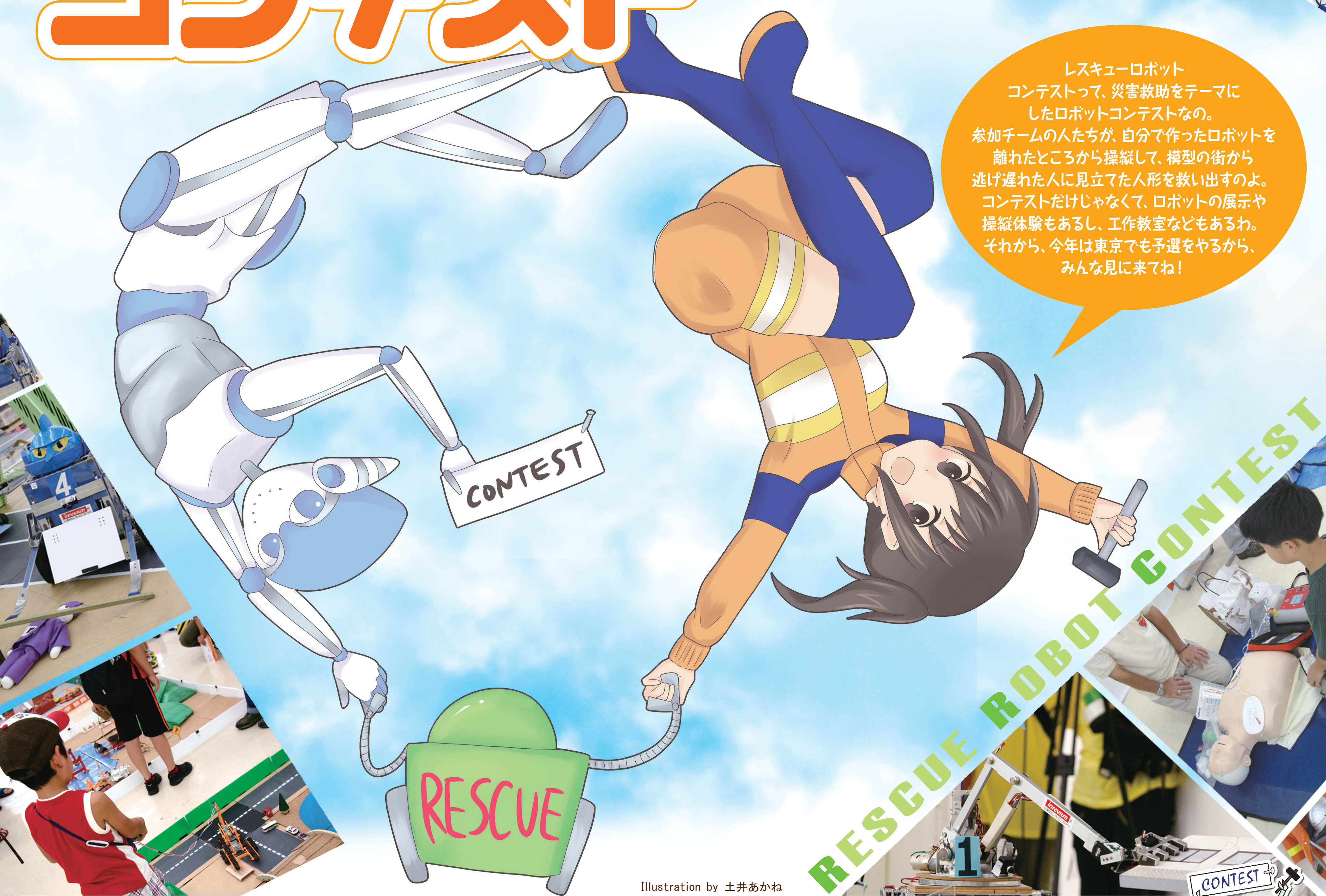
Illustration by 土井あかね

レスキューロボット コンテストって、災害救助をテーマに したロボットコンテストなの。 参加チームの人たちが、自分で作ったロボットを 離れたところから操縦して、模型の街から 逃げ遅れた人に見立てた人形を救い出すのよ。 コンテストだけでなく、ロボットの展示や 操縦体験もあるし、工作教室などもあるわ。 それから、今年は東京でも予選をやるから、 みんな見に来てね!