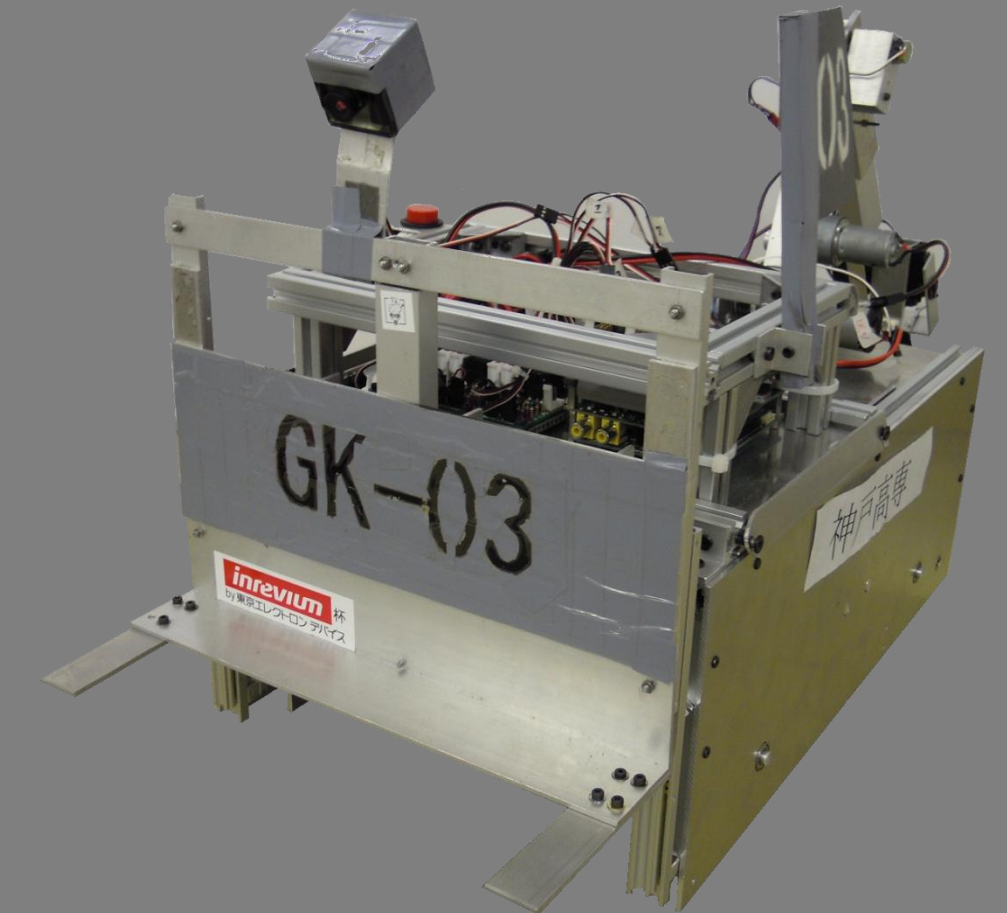
3号機 ぴすけす Pisces