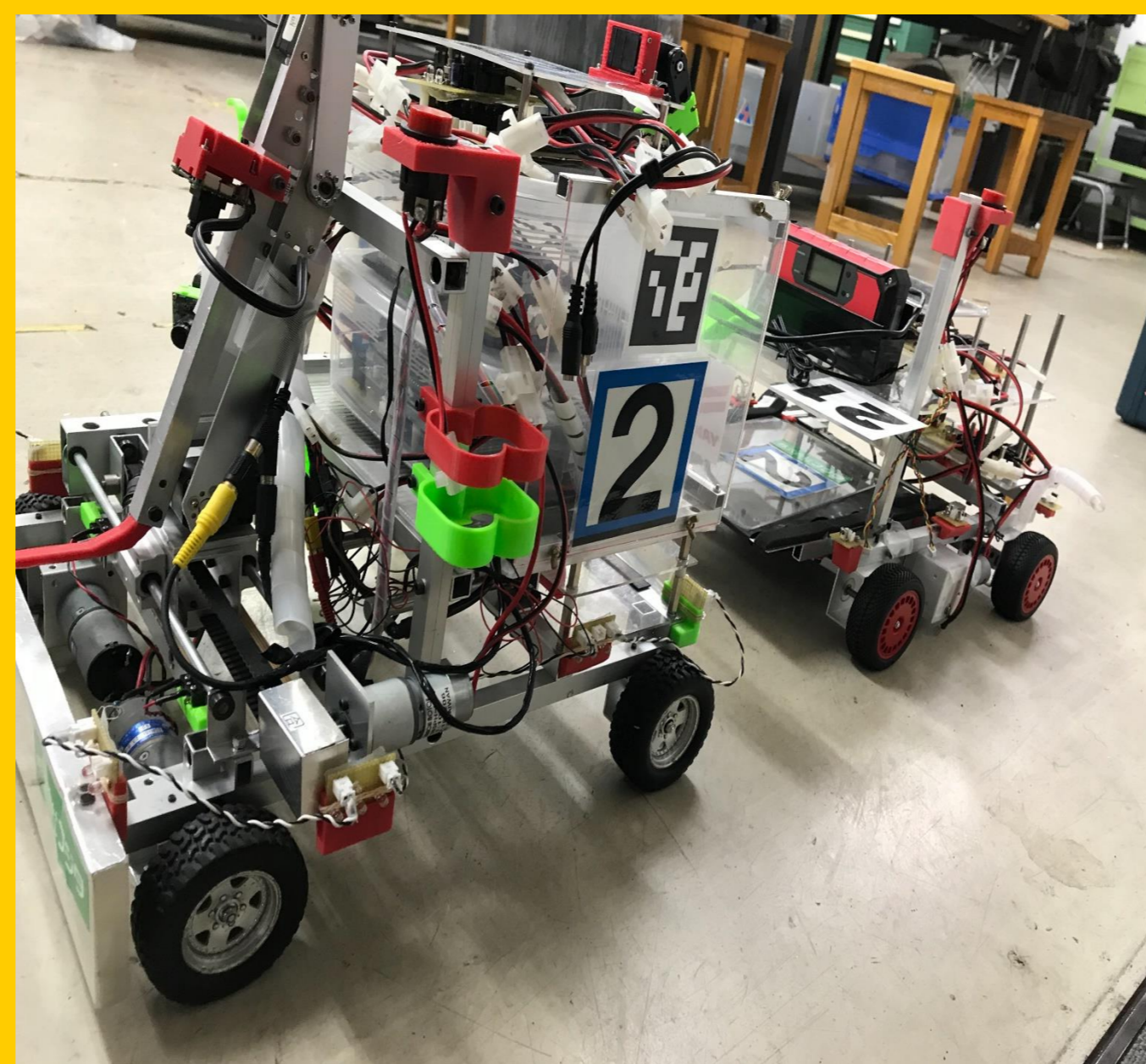
2号機 三軸アーム 自立移動ロボット