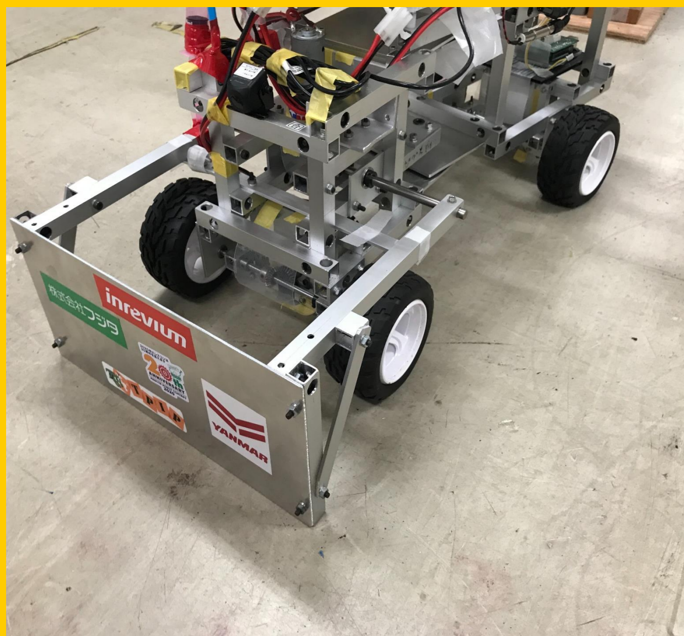
1号機 凹凸道への橋掛け 瓦礫除去ブレード